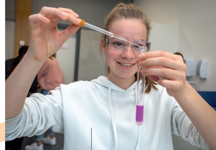
Eine Säure wird mit einer Base versetzt. Der Farbumschlag des Indikators zeigt den Neutralisationspunkt an.