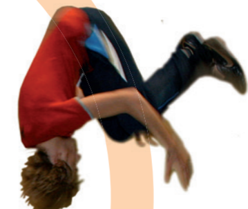
Die IGS Selters bietet für jeden den geeigneten „Absprung“