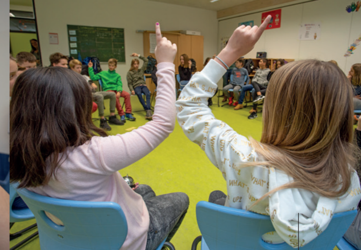
Der Klassenrat einer 7. Klasse berät, stimmt ab und entscheidet, was an der Weihnachtsfeier gemacht werden soll. Leitung, Protokoll und Zeitkontrolle übernehmen die Schüler selbst.