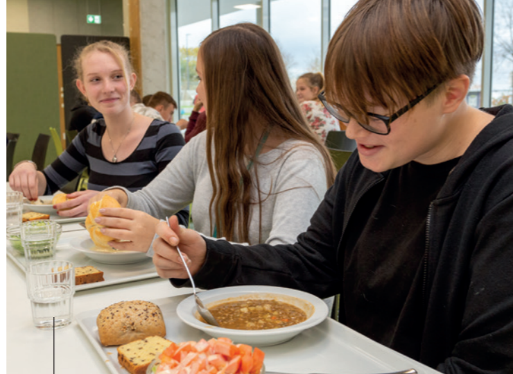
Die moderne und freundlich gestaltete Mensa gehört zum Alltag in der Ganztagschule